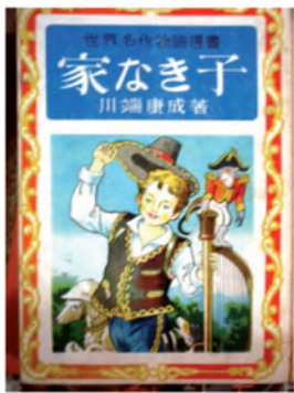
1950, adapté par Yasunari Kawabata