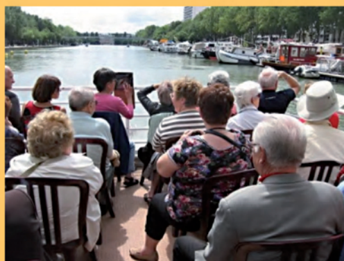
Le 14 juin, Voyage des Aînés.

Chacun s'installa autour des tables et bancs de la commune afin de se restaurer et reprit des forces pour le jeu de la corde où les plus jeunes, surtout les filles, ont excellé en remportant l'épreuve au