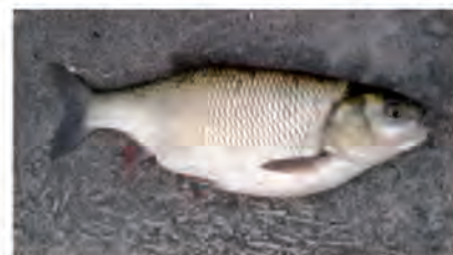
Chevesne pris le 11/10/2012 à La Bouille

Souvent le compagnon des deux premiers cités ci-dessus, le mulet commun , poisson d'eau saumâtre, remonte les grands fleuves et repart en mer ; très vivace, on le remarque dans l'eau par ses éclats argentés. Taille : de 20 à 45 cm. Pêche aux graines et à fond il fouille dans la vase pour se nourrir.