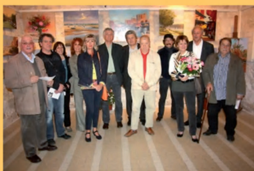
Le 16 mai, Salon de Peinture.