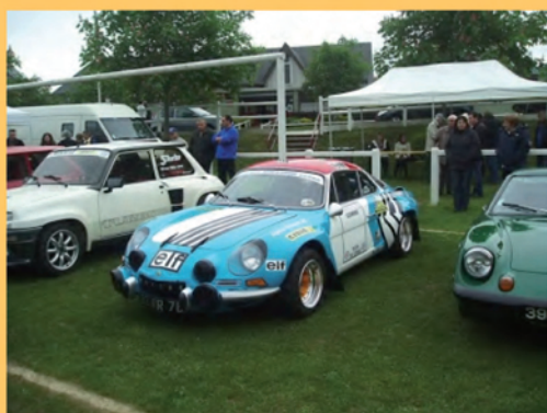
Le 6 mai, Rassemblement Renault.