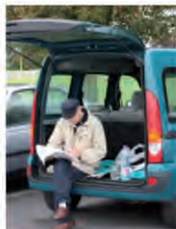
Un peintre courageux

Les lauréats des diverses journées peintures de la région se retrouveront en concurrence à La Bouille fin septembre (précisions à venir).