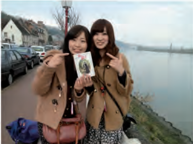
« un livre connu au Japon »

A.A : Les mois de juin, août et septembre. La période de février-mars est également très appréciée, mais pour des raisons climatiques et d'accès au village, le passage à la Bouille est stoppé de mi décembre à début mars.