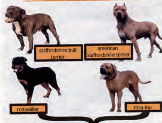
chiens de la deuxième catégorie (Chiens de garde et de défense)

Les chiens susceptibles d'être dangereux sont définis réglementairement. Ils sont répartis en 2 catégories : les chiens d'attaque et les chiens de garde et de défense.