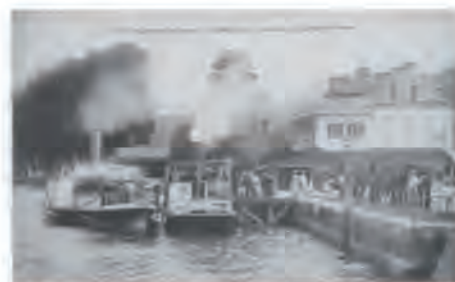
Embarcadère du bateau de La Bouille

Le Programme définitif sera communiqué mi-mars 2013