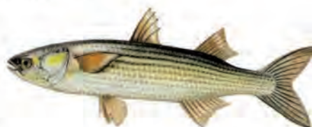
Le Mulet doré

Souvent le compagnon des deux premiers cités ci-dessus, le mulet commun , poisson d'eau saumâtre, remonte les grands fleuves et repart en mer ; très vivace, on le remarque dans l'eau par ses éclats argentés. Taille : de 20 à 45 cm. Pêche aux graines et à fond il fouille dans la vase pour se nourrir.