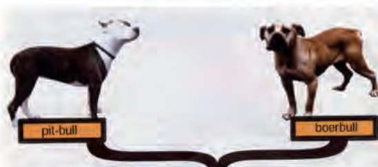
chiens de la première catégorie (Chiens d'attaque)