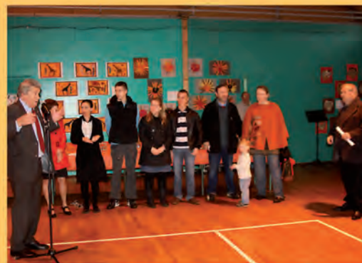
Le 20 octobre, Accueil des nouveaux Bouillais