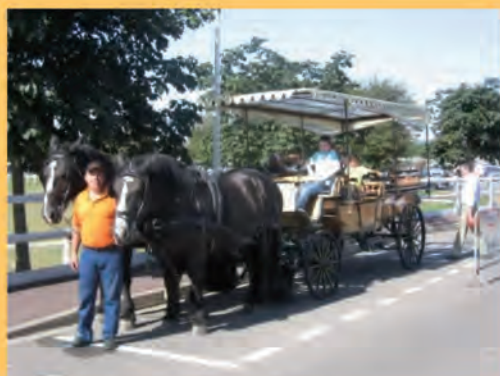
Le 9 septembre, Forum des Associations.