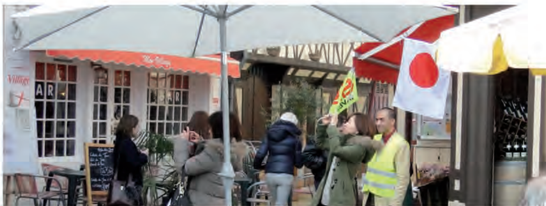
« Visiter les beaux villages français est devenu très à la mode pour les Japonais »

K.W : Et l'histoire littéraire et artistique du village, avec la maison natale d'Hector Malot, et la présence des peintures impressionnistes.