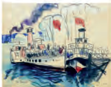
Tableau de Le Trividic