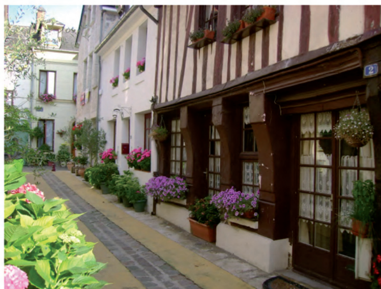
*Riverains du Haut de la Rue Magalon