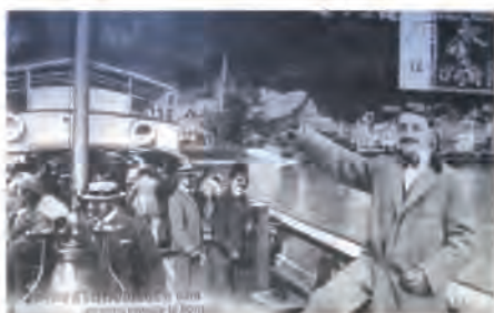
« J'arrive à La Bouille »