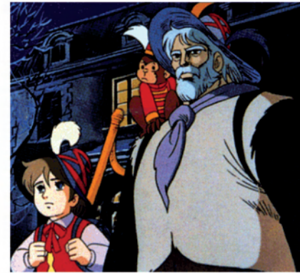
Dessin animé par O. Dezaki, en 1977-1978