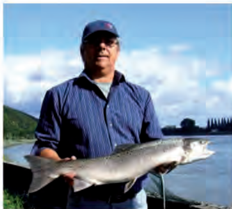
Saumon atlantique le poisson Roi pour tout pêcheur ! 81 cm et 6,7 kg pris mi octobre 2012.