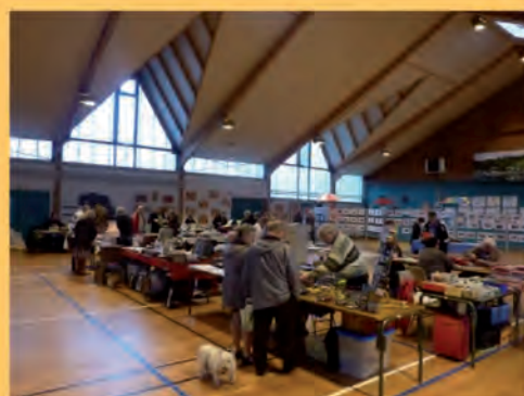
Le 21 octobre, Salon des Collections.