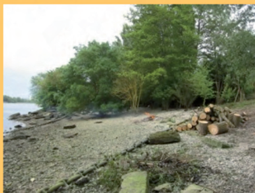
Le 29 mai, Les Berges Saines.