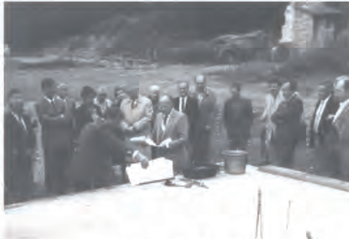
Ère pierre du Vracq