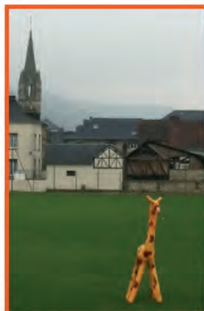
Octobre 2012, un moment insolite : Une girafe à La Bouille ?

Tél. : 02.32.81.55.10 Fax : 02.32.81.55.19