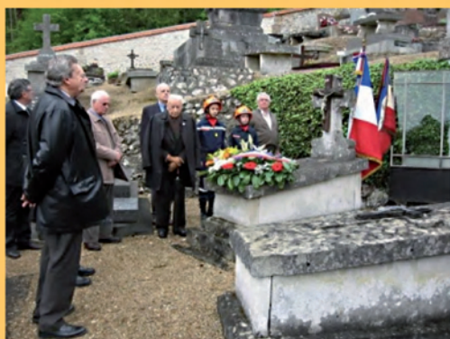
Cérémonie du 8 mai.