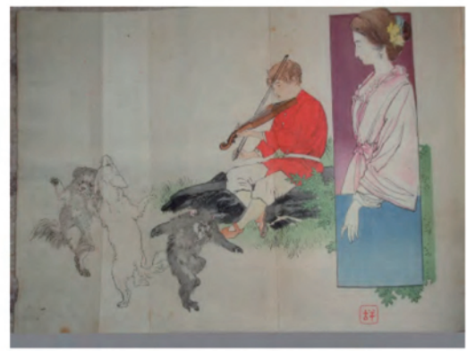
1 ère édition en 1903, Mada Minu Oya , illustrée par Hanko Kajita

Il y a eu près de 200 sortes d'éditions différentes du roman Sans famille au Japon, plus 5 mangas ! La 1ère édition en volume date de 1903 : Mada Minu Oya par Sosen Gorai. Puis, en 1912, Ië Naki Ko , par Yuho Kikuchi. Et, en 1950, l'adaptation par Yasunari Kawabata (Lauréat du prix Nobel de littérature).