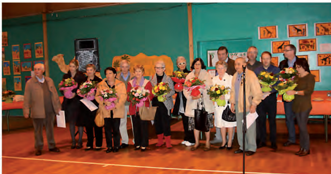
Remise des prix aux lauréats bouillais, le 20 octobre