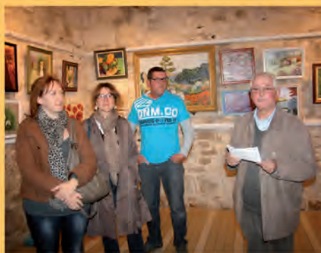
Le 20 /21 oct., Expo. des Peintres bouillais.